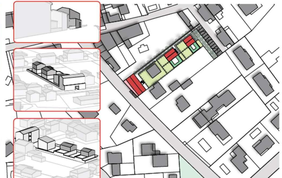
Mireval-Lauragais Aude (11)/ 163 habitants / MOE : Perris et Perris architectes / Livraison 2016